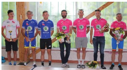
Coupes, fleurs et maillots ont été offerts aux vainqueurs

Une distribution des prix attendue par un nombreux public qui tout au long de la journée a montré que les conditions sanitaires ne les avaient pas arrêtés et qu'ils étaient présents pour encourager les cyclistes de tout âge et qu'il soit homme ou femme, les kilomètres ne leur faisant pas peur.